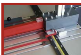
Patentierter Niederhalter hält das Werkstück beim Sägen fest und verhindert Verletzungen