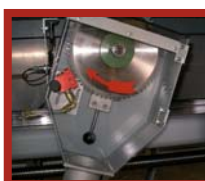
Sägeblatt in der Werkzeugwechselposition, mit Feststellbolzen und Sprühvorrichtung (Option)