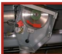
Sägeblatt in der Werkzeugwechselposition, mit Feststellbolzen und Sprühhvorrichtung (Option)